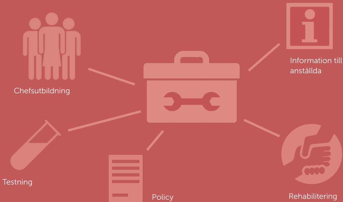
FIGUR 1. VERKTYGSLÅDAN BESKRIVER VIKTIGA DELAR I ETT ALKOHOL- OCH DROGPREVENTIVT ARBETE PÅ EN ARBETSPLATS

Exempel på sådana åtgärder är en skriftlig alkohol- och drogpolicy, information och utbildning till all personal, särskild utbildning och träning av chefer, samt rutiner för att erbjuda stöd- och rehabiliteringsinsatser.